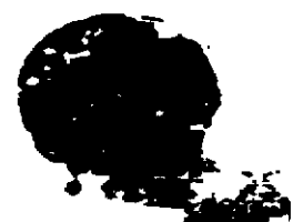
صورة الصفحة الأخيرة من الأصل ( النسخة السلیمانیاة ) .